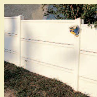
Variante avec plaque 1/2 chaperonnée