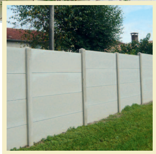
Clôture écran classique pour ligne d'horizon